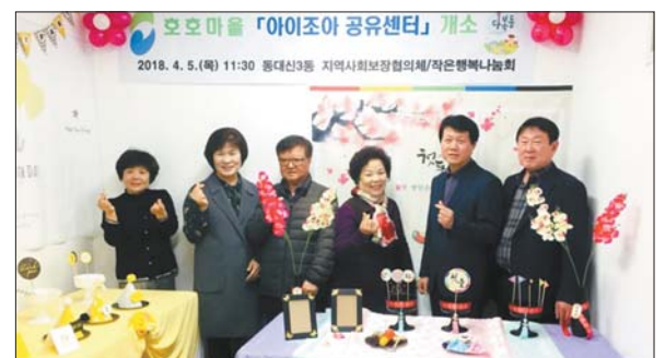
사진은 호호마을 아이조아공유센터 개소식 모습.