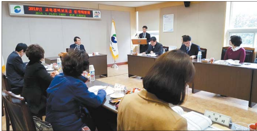
사진은 지난 3월 21일 개최된 교육경비보조금심의위원회 모습.

생존수영교실은 지난해 초등학교 3학년에서 올해에는 3~4학년으로 확대됐는데 총 1천167명이 훈련(10시간