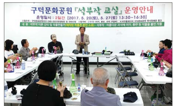
사진은 지난해 석부작교실 수업 모습.