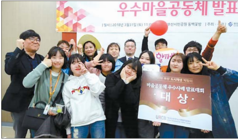
사진은 마을공동체 우수사례 발표대회에서 대상을 차지한 'YOLO'와 관계자들 모습.

서구는 프로젝트를 추진하면서 지역 청소년들에게 주목했다. 물리적인 도시재생 방식으로 마을을 변화시키기에는 한계가 있는데다, 65세 이상이 24.9%(서구 평균 1.3배), 기초수급자가 7.5%(서구 평균 4.7배)인 지역여건이 지역청소년