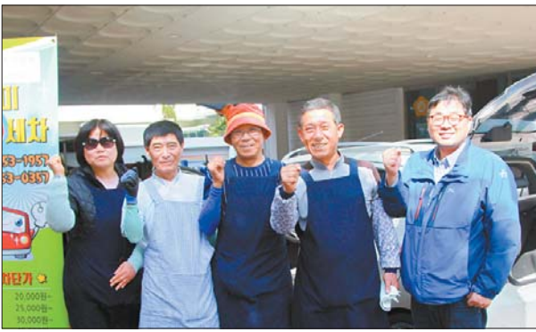
사진은 자활의 꿈을 키우고 있는 푸르미출장세차(사진 왼쪽)·향기나운동화빨래방 사업단 관계자들 모습.