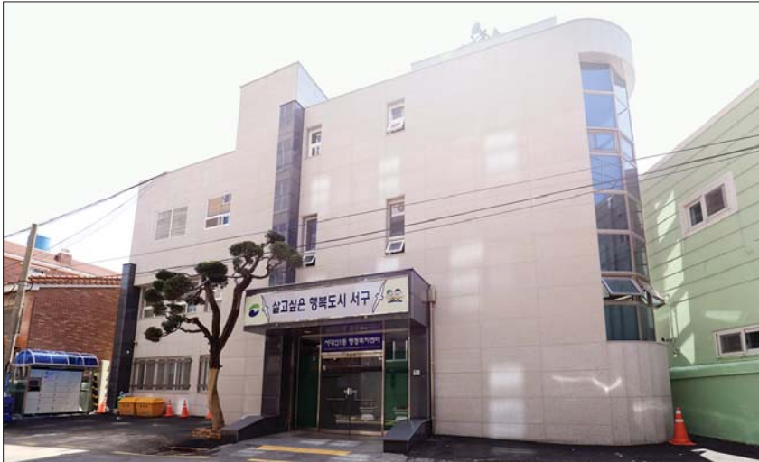
사진은 기존 행정복지센터를 리모델링해 조성된 서대신1동 복합커뮤니티센터 모습.

초건강관리 및 상담, 이동건강클리닉, 건강프로그램 운영 등을 통해 주민 건강지킴이 역할을 하게 되는데 본격적인 운영은 5월 초부터 시작된다.