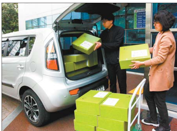
사진은 구청 직원들이 홀로 사는 중장년층에게 전달할 ‘셀프 푸드’를 차에 싣고 있는 모습.

한편 서구는 고독사 예방을 위해 올해 만 40세 이상을 대상으로 하는 ‘1인 가구 전수조사’ 등 복지사각지대 조사를 지속적으로 실시하는 한편 서