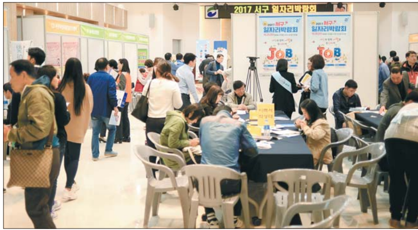
사진은 지난해 개최된 서구 일자리박람회 행사장 모습.

민간부문에서도 320개의 일자리를 만든다는 방침이다. 서구는 이를 위해 주택 재개발 사업이나 관급공사를 맡은 대형 건설사와 MOU를 체결해 서구민 우선채용을 유도하고 있으며, 유동인구가 많은 장소에 사회적·마을기업 생산제품 홍보 전 시공간을 마련하는 등 기업의 판로 개척활동도 적극 지원하기로 했다. 특히 올해에는 송도용궁구름다리, 송도해양레저타운, 내원정사 템플스테