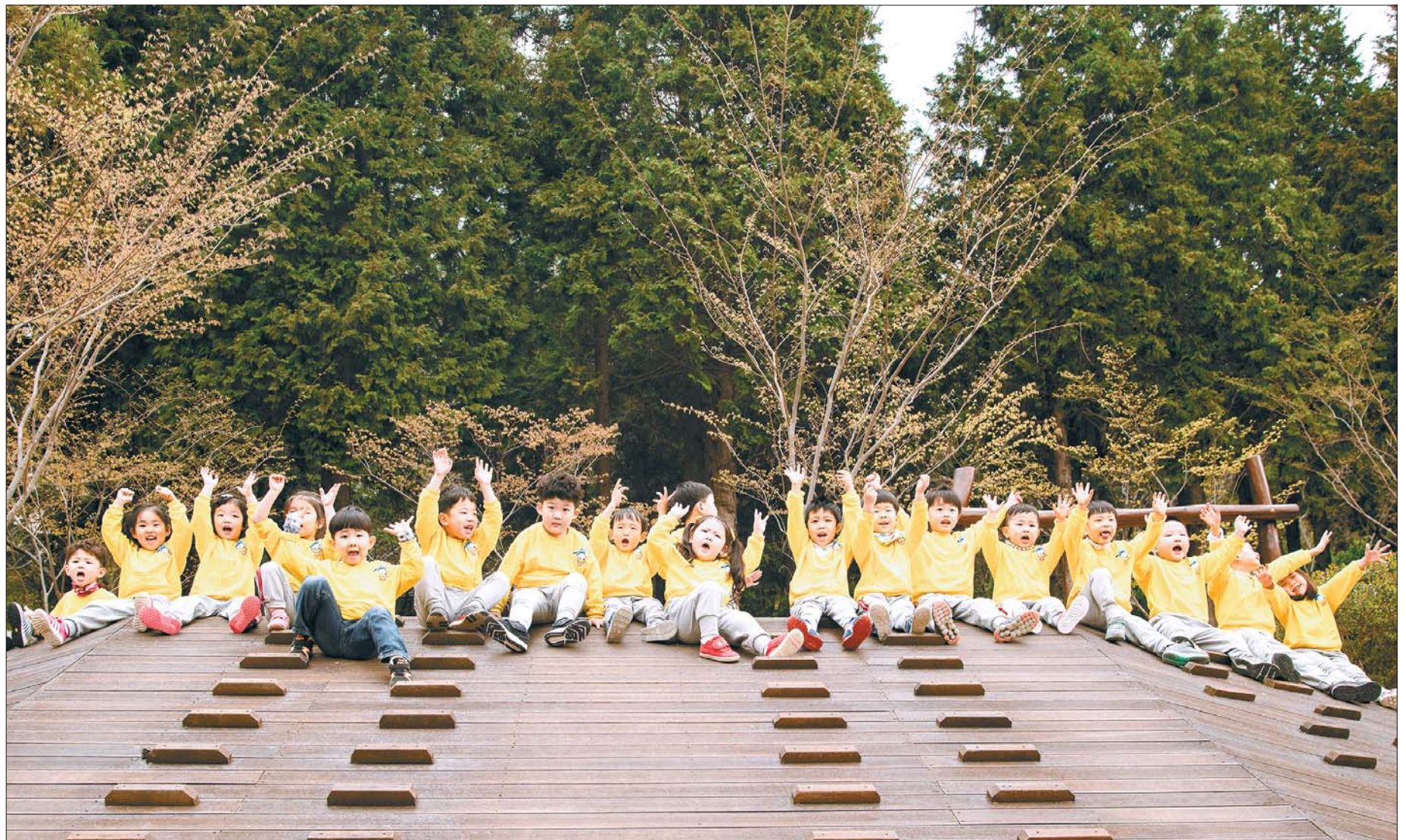
“우리는 숲에서 더 자라요”

서구가 직영하는 유아숲체험시설이 엄광산에 이어 구덕산에 오는 9월까지 문을 열 예정이다(사진은 지난 4월 9일 엄광산유아숲체험장을 찾은 서대신동 성심어린이집 원아들이 ‘나무언덕 오르기’를 한 뒤 두 손을 번쩍 들어보이며 즐거워하고 있는 모습).