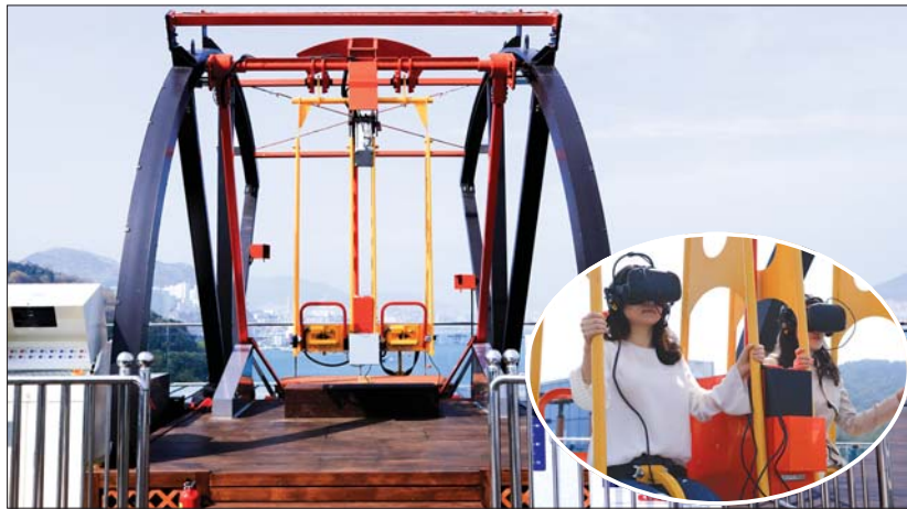
사진은 세계 최초 'VR 스카이스wing'과 시범 체험 중인 방문객들(작은 사진)의 모습.

'VR 스카이스wing'은 공중그네 체험 시뮬레이터로는 세계 최초이며, 실제 공중그네는 해발 110m 높이의 네덜란드 암스테르담 전망타워에 위치한 '오버 더 엣지'가 유명하다.