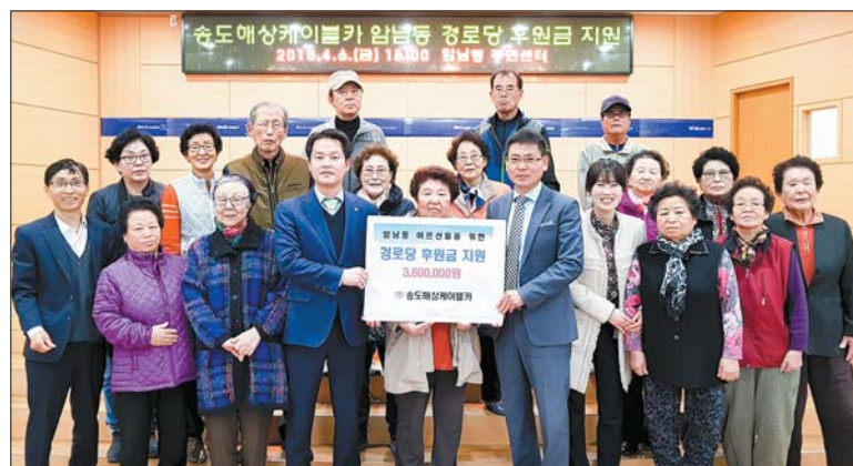
사진은 송도해상케이블카 관계자가 암남동 경로당 후원금을 전달하는 모습.