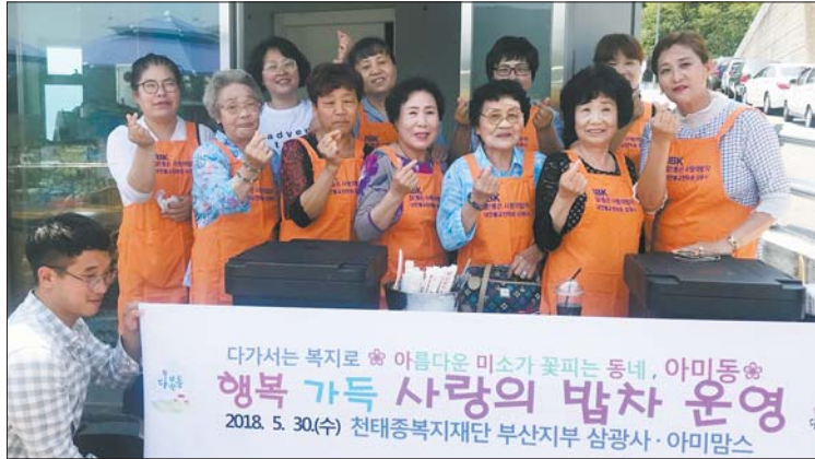
사진은 ‘사랑의 밥차’의 자원봉사자로 나선 아미맘스와 주민들 모습.