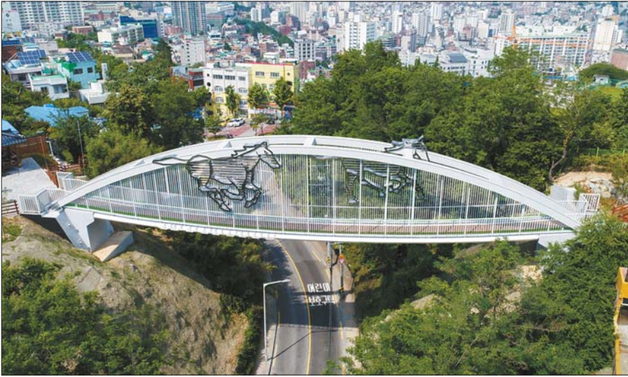
사진은 천마산을 향해 달려가는 천마를 형상화한 시약산-부민산 연결 천마다리 모습.