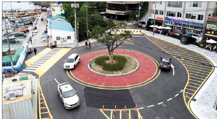
사진은 지난 6월 초 개통한 송도해안블레길 입구의 회전교차로 모습.

게다가 최근 몇 년 사이 송도해수욕장에 해상케이블카, 구름산책로, 오션파크 등 관광인프라가 잇달아 구축돼 방문객과 차량이 폭증하고 있는데다 특히 주말과 공휴일에 단체관광객을 태운 대형버스까지 가세하면서 이 일대의 교통체증을 부채