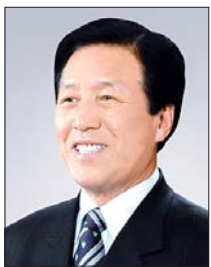
변태한 후반기 의장

돌이켜보면 그간 지방자치는 온갖 어려움과 열악한 환경 속에서 많은 변화를 거듭해 왔지만, 저를 포함한 우리 지방의회는 흔들림 없이 지역주민의 작은 소리에도 귀 기울이며, 민의의 대변자로서 소임을 충실히 해 왔다고 생각합니다.