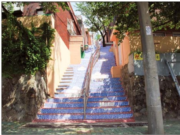
사진은 동일이마을 어귀길 정비 사업과 풀마루 & 산마루길 조성 사업으로 달라진 동대신1동 모습.