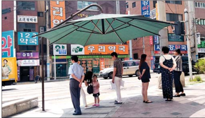
사진은 지난해 부산대학교병원 앞 횡단보도에 설치됐던 그늘막 모습.

무더위쉼터가 마련된 곳은 13개 동 주민센터, 셋디체력단련장(남부민2동), 장수동 일경로당(동대신1동), 서부·동이부녀경로당(동대신2동), 산월경로당(서대신1동), 서대2경로당(서대신1동), 꽃마을·꽃마을부녀경로당(서대신4동), 아미1경로당(아미동), 상조경로당(남부민2동), 모지포경로당(암남동), 부민노인복지관(부민동), 서구노인복지관(암남동) 등이다.