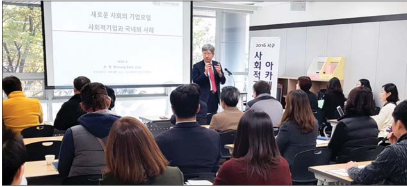
사진은 지난 2016년 개최된 사회적 경제 아카데미 모습.

서구는 우선 낮은 인지도를 끌어올리기 위해 사회적 경제 엠블럼을 제작하고 이를 활용한 홍