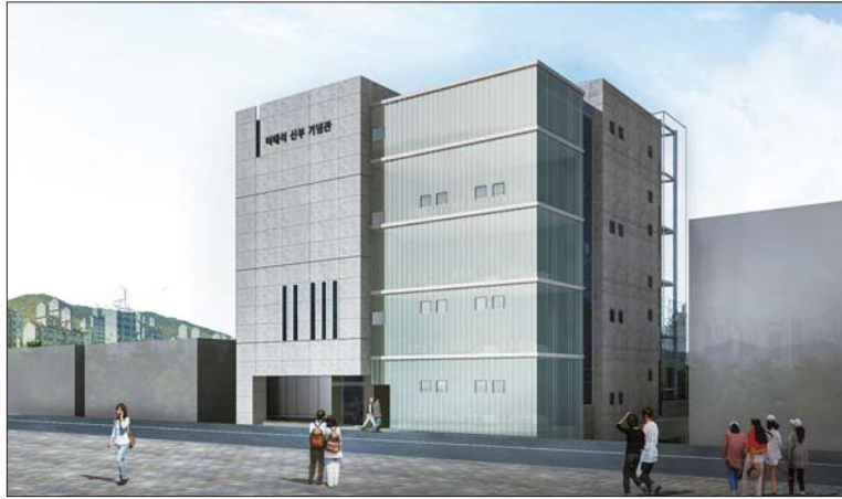
사진은 이태석 신부 기념관 조감도.

현재 이곳에는 지난 2014년 9월 건립된 이 신부의 생가와 주민들이 직접 만든 수공예품이나 이 신부 관련 상품을 개발·판매하기 위해 지난해 5월