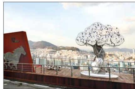
사진은 남부민동 누리바라기전망대 모습.

8월의 테마는 '바다를 느껴라, 해양레저'이다. 송도해수욕장에서는 오는 8월 25~26일 바다카약·비치사커·핀수영·해상다이빙·SUP 등 5개 종목으로 송도 전국해양스포츠대회가 열릴 예정으로 이곳에서 경기참