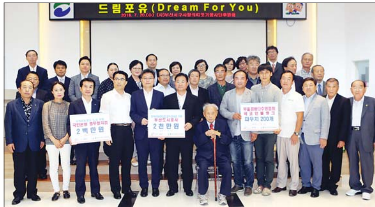
사진은 지난 7월 20일 ‘드림 포 유’ 행사 뒤 참석자들의 기념촬영 모습.