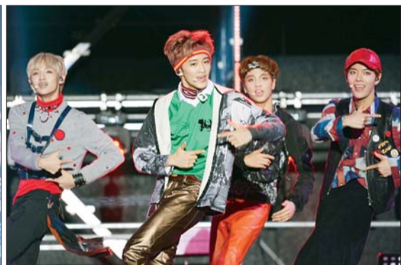
사진은 현인가요제 본선에서 있었던 초청가수들의 공연 모습. 사진 오른쪽이 10대 소녀들의 폭발적인 호응을 얻었던 아이돌그룹 NCT127의 모습.