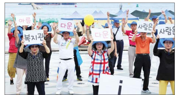
사진은 선배시민대학 참가자들의 사업 홍보 플래시몹 모습.

서구노인복지관이 선배시민 양성 및 성공적인 노년기 사회참여를 지원하기 위해 사회복지공동모금회의 지원사업으로 운영 중인 선배시민대학이 눈길을 끌고 있다.