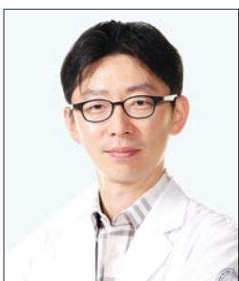
이 호 석 흉부외과 교수