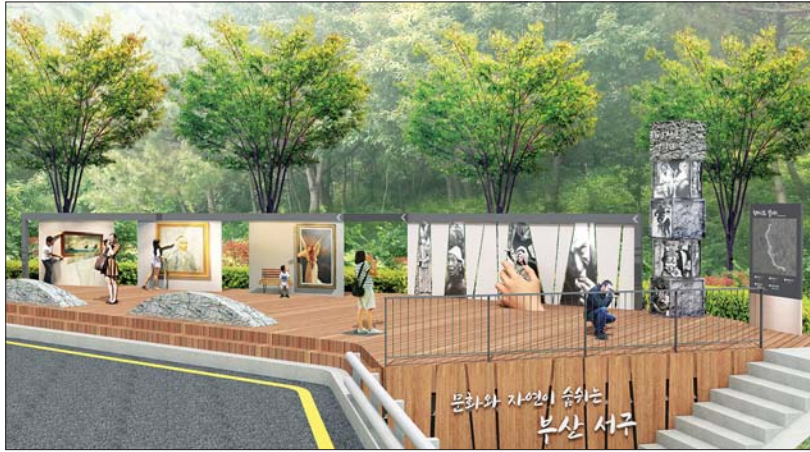
사진은 천마산로에 조성될 야외 사진갤러리를 갖춘 하늘산책로 일부 구간 모습.

5차년도 사업의 핵심사업으로 인근 최민식갤러리와 연계할 경우 사진을 테마로 한 독특한 관광루트로 될 수 있으며, 최민식갤러리, 비석문화마을, 감천문화마을을 잇는 새로운 관광벨트 조성도 기대할 수 있다."라고 밝혔다.