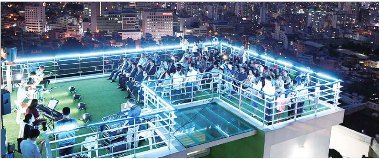
사진은 지난 8월 5일 초장동 천마산에코하우스에서 열린 '2016년 산복도로 옥상달빛극장' 개소식 모습.