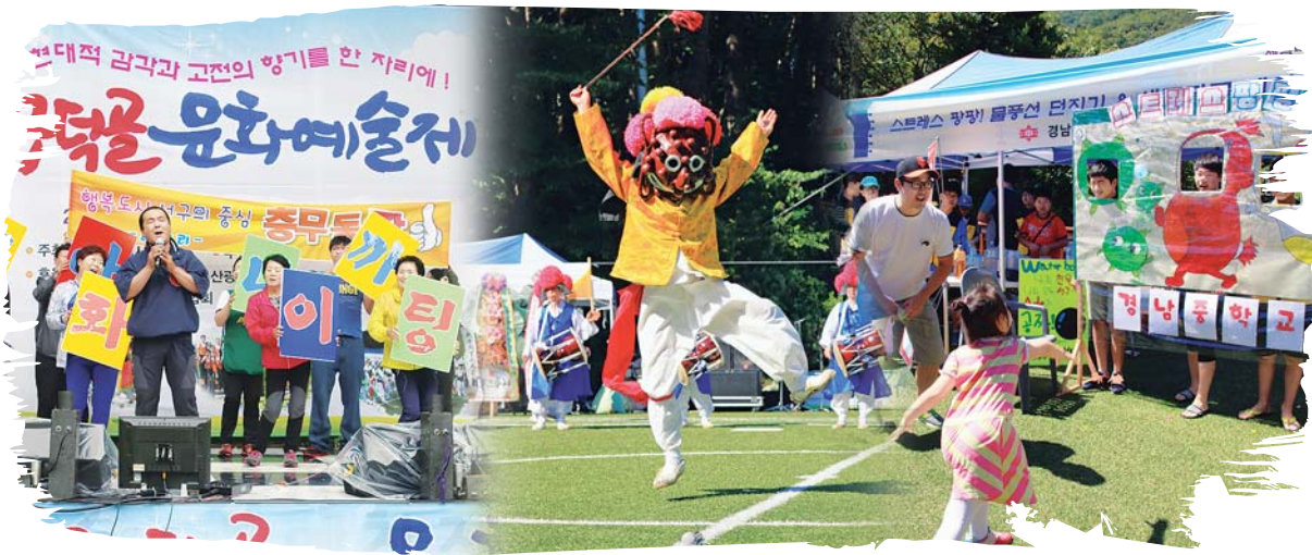
사진은 지난해 제17회 구덕문화예술제에서 마련된 무형문화재 공연과 다양한 주민 참여행사 모습.