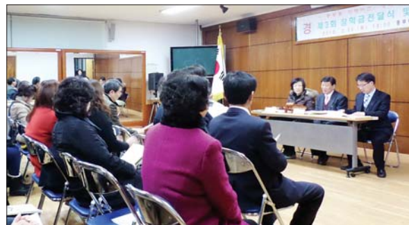
사진은 지난 2월 열린 제3회 장학금 전달식 및 이사회 모습.

김차순장학회는 주민들의 적극적인 참여에 고무돼 1억 원 모금 후 장학금을 지급하려던 계획을 변경해 2014년부터 고등학생 12명에게 총 560만 원의