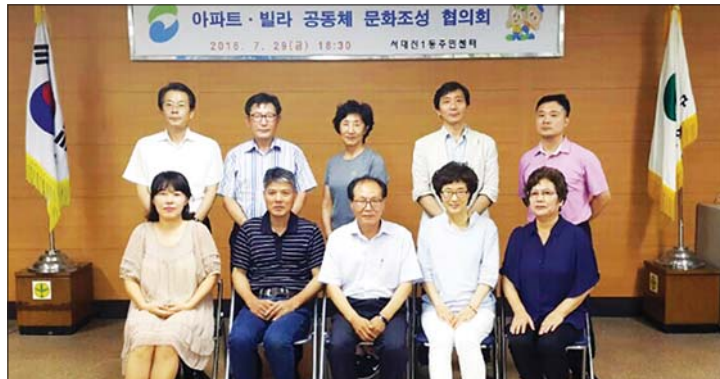
사진은 서대신1동 아파트·빌라공동체문화조성협의회 대표자들.

협의회의 목표는 아름답고 살기 좋은 지역공동체 만들기다. 이를 위해 이웃 간 인사 나누기, 화단 가꾸기, 각 세대 화분 비치, 에너지절약 캠페인, 안 쓰는 물건 교환, 태극기 공동 구매, 자동차 카풀 등을 통해 쾌적한 주거환경과 함께 하는 문화 만들기 등에 나선다. 또 최근 논란이 되고 있는 층간 소음문제나 아파트 내 흡연문제 등 민감한 사안에 대해서도 머리를 맞대고, 독거노인 안부 확인이나 경로당 후원 등에도 함께 나서는 등 더불어 살아가는 공동체 의식을 강화하는 활동도 계획하고 있다. 뿐만 아니라 아파트나 빌라 별로 1차