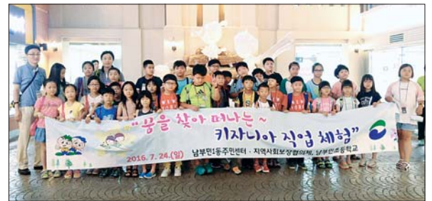
사진은 남부민1동 어린이들의 키자니아 직업체험 모습.