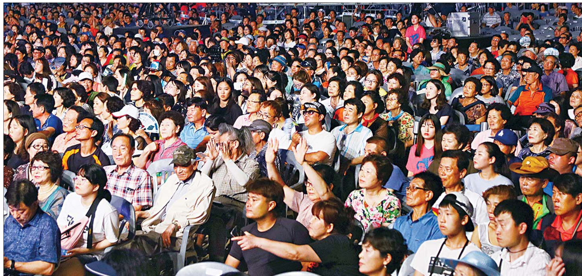
사진은 제12회 현인가요제 본선이 열린 지난 8월 7일 송도해수욕장에서 관객들이 초청가수의 공연을 즐기고 있는 모습.

아침 송도해수욕장에 도착했다는 이모 양(울산·대학생)은 "아이돌그룹 EXO가 초청가수로 나왔던 2년 전에도 현인가요제를 보러왔다. 오늘은 운 좋게 1번으로 입장해 가까이서 NCT를 볼 수 있어 기분이 좋다. 현인가요제에서 좋아하는 아이돌가수들의 공연을 볼 수 있어 반갑고 기쁘다."라고 말했다.