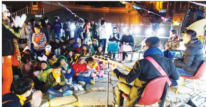
사진은 지난해 ‘아미동에서 놀자’에서 주민들이 통기타 공연을 즐기고 있는 모습.

도 기대를 모은다. 아미실버악단, 아미맘스, 주민 자치회 프로그램 아동풍물팀, 초·중학생과 대학생 팀 등이 노래와 춤, 연주 실력을 뽐내고 7080가수와 초청가수들이 무대에 올라 분위기를 북돋운다.