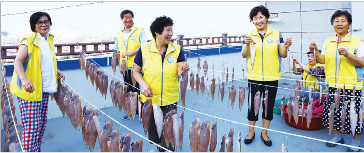
사진은 '남일이네 사랑의 생선가게' 관계자들이 생선 건조작업을 하며 밝게 웃고 있는 모습.