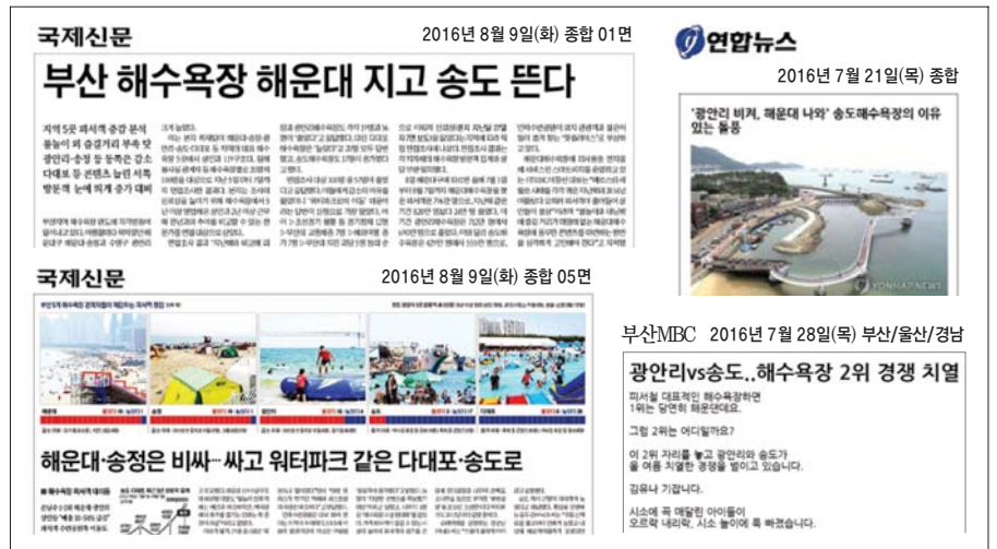
사진은 최근 각 언론에 보도된 송도해수욕장 관련 기사들.

각 언론사들은 송도해수욕장의 흥행 이유도 분석·보도하고 있다. 지난 6월 1일 완전 개통한 국내 최장