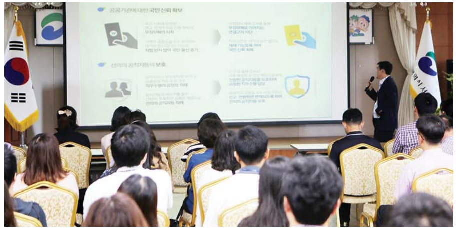
사진은 지난 9월 1일 구청 대회의실에서 실시된 직원 대상 ‘청탁금지법’ 교육 모습.

서구 관계자는 “우리 구는 공직비리에 대한 경각심을 일깨우기 위해 지난해 5월부터 구청 전 부서 출입구에 카운트 게시판을 설치해 ‘청렴 365일 운동’을 실시하고 있는데 현재까지 단 한 건의 비리사태가 나오지 않을 정도로 청렴에 대한 자긍심을 가지고 있다.”고 말하면서 “청탁금지법 시행을 계기로 청렴 이미지를 더욱 강화해 나가겠다.”라고 강조했다. (문의 기획감사실 240-4053)