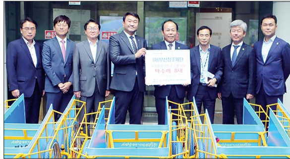
(재)부산창조재단(대표 김영도)은 지난 8월 30일 폐지수집 어르신을 위한 맞춤형 손수레인 '따뜻한 수레' 8대와 백미 20kg 8포를 서구청에 지원했다.