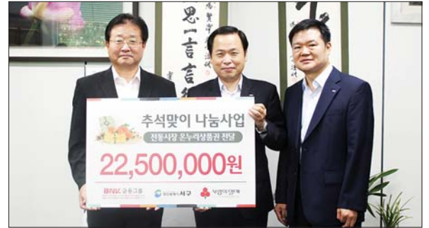
BNK금융그룹 희망나눔재단은 추석맞이 나눔사업의 일환으로 지난 8월 31일 관내 저소득 주민들에게 전달해 달라며 2천250만원 상당의 온누리상품권을 서구청에 전달했다.