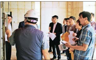
남부민1동 주민복합커뮤니티센터 건립