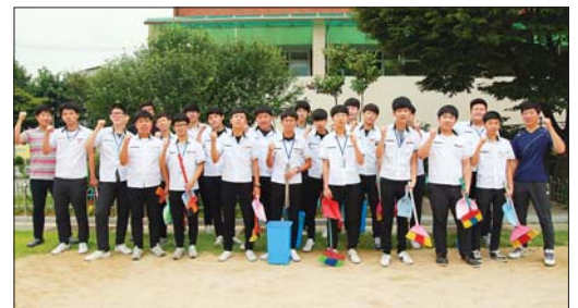
사진은 아침 골목길 청소 나선 경성전자고 학생들.