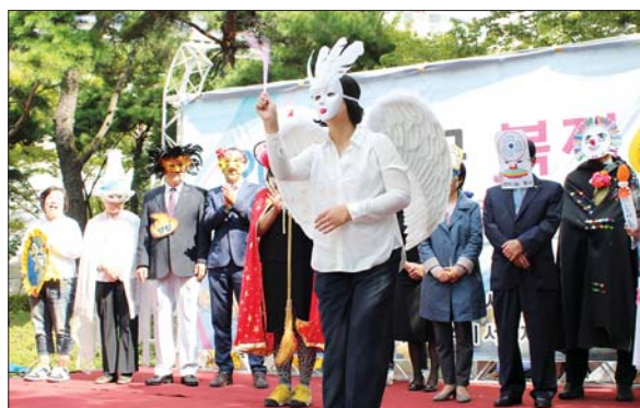
사진은 지난해 '복지가왕 콘테스트' 모습.

다른 지역 복지박람회와 차별화되는 신선하고 재미있는 아이템도 선보인다. 가장 눈길을 끄는 것은 '복지스타★ 개사가요제'로 지난해 '복면가왕'을 패러디한 '복지가왕 콘테스트'에 이은 시즌 2로 복지에 대한 긍정적인 메시지를 노래를 통해 효과적으로 홍보한 기관·단체를 시상한다.