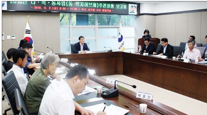
사진은 지난 9월 2일 열린 ‘다·복·동 사업’ 추진상황 보고회 모습.

서구가 주민들의 복지 체감도를 높이기 위해 지난 5월부터 남부민1·2동과 초장동에서 추진 중인 ‘다·복·동 사업(주민에게 더 가까이 다가서는 복지동)’이 뚜렷한 성과를 거두고 있는 것으로 나타났다.