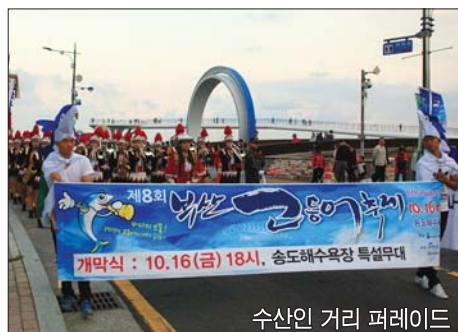
수산인 거리 퍼레이드

'고등어 홍보영상 공모전'은 서구 또는 고등어를 잘 표현한 영상물(다큐, CF)을 대상으로 한다. 9월 30일까지 접수해 10월 9일까지 유튜브 등을 통해 본선 진출자를 선정하고 10월 16일 오후 6시 LED전광판을 통해 상영한 뒤 4명(팀)에게 총 150만 원의 상금을 수여한다.