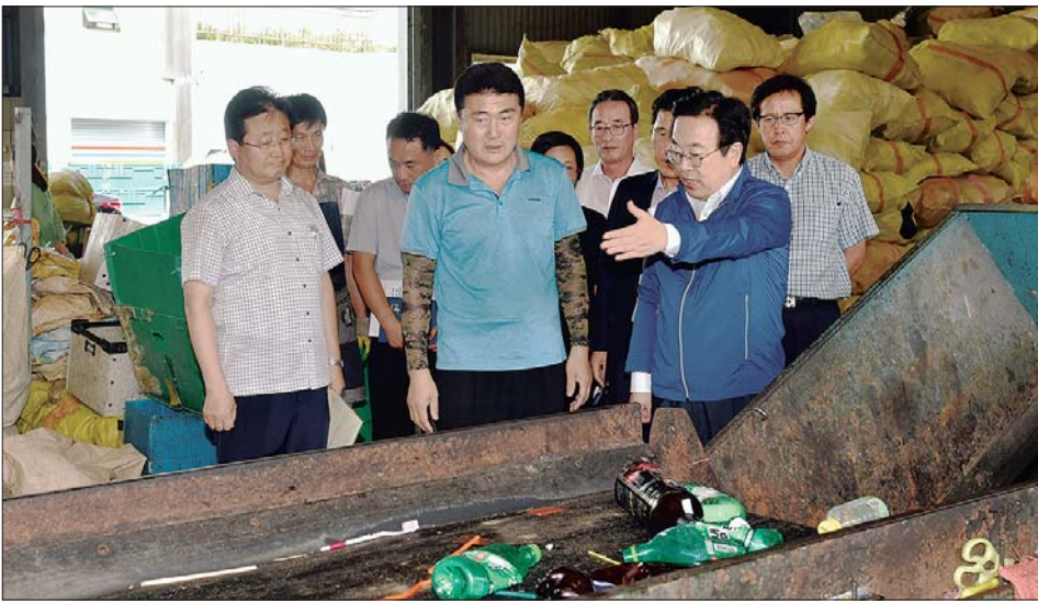
사진은 지난 8월 23일 서구환경종합단지 재활용 선별장을 방문한 서병수 시장(사진 오른쪽 앞)이 관계 공무원으로부터 현황을 보고받으며 이야기를 나누고 있는 모습.