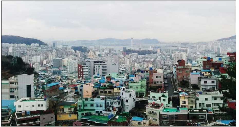
1909년(왼쪽 사진)과 최근의 아미동 일대 모습. 100여 년 새 산과 바다를 제외하면 흔적을 찾을 수 없다(왼쪽 사진 아래쪽에 막대기처럼 삐죽삐죽 올라온 하얀색이 일본인 공동묘지의 비석들).

피란·철거민 이주지... 주거환경 열악, 인구 64% 감소, 고령화율 23%