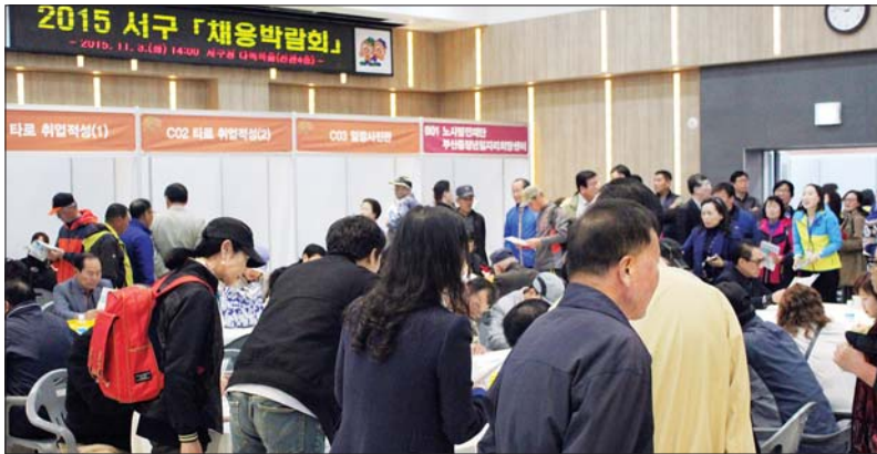
사진은 서구청 신관 다목적홀에서 열린 '2015 서구 채용박람회' 모습.

서구는 행사장을 찾는 구직자들이 취업 목표를 달성할 수 있도록 부산 소재 100인 이상(서구 20인 이상)기업에 안내문을 보내 참여를 요청하는 한편 부산지방고용노동청, 한국산업인력공단 등