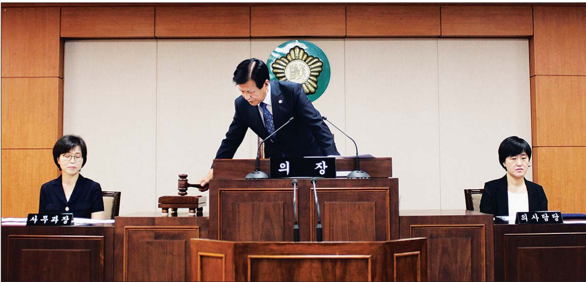
사진은 지난 8월 26일 열린 제223회 서구의회 임시회 제1차 본회의 모습.