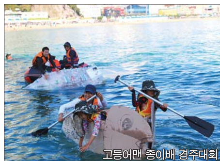
고등어맨 종이배 경주대회