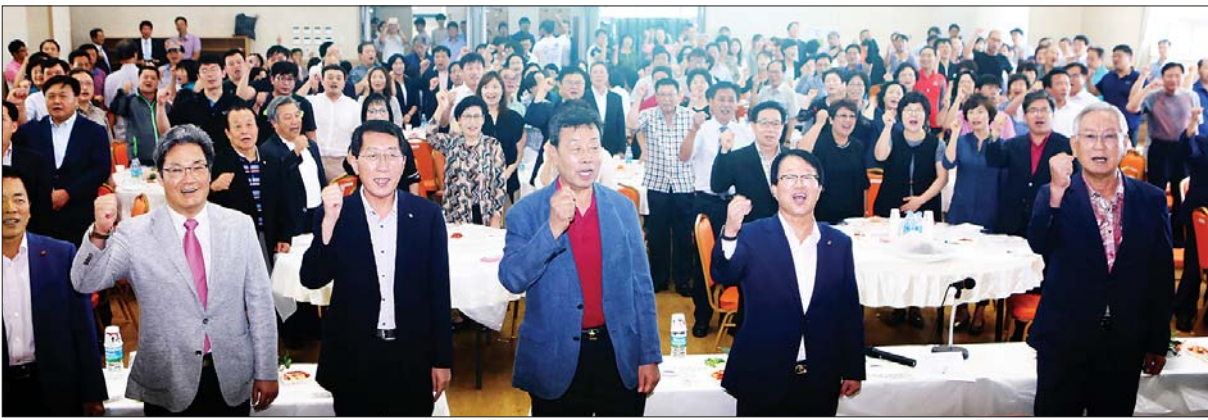
사진은 지난 9월 8일 활어회 시식회에서 참석자들이 지역 수산물의 소비촉진을 촉구하고 있는 모습.