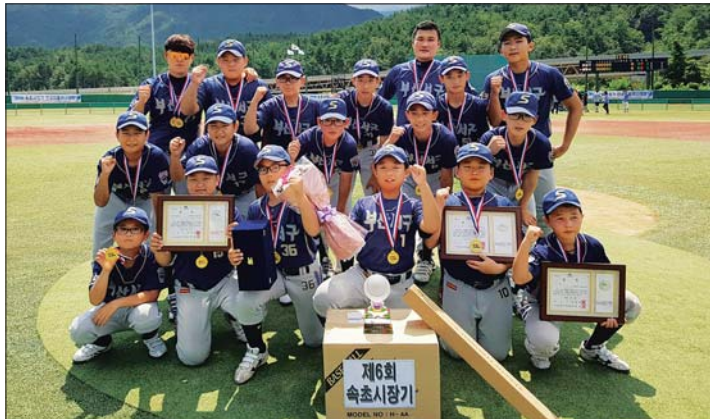
사진은 속초시장기 전국리틀야구대회에서 우승한 서구리틀야구단 모습.

서구리틀야구단은 야구 꿈나무 육성과 유소년 야구 발전에 기여하기 위해 지난 2008년 11월 창단했는데 지난 2004년 박찬호배 전국리틀야구대회를 시작으로 2015년에는 KBO U12 전국유소년야구대회, 제5회 속초시장기 전국리틀야구대회, 제26회 롯데기 유소년야구대회에서 우승의 감격을 맛보았으며,