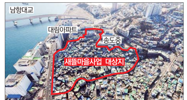
사진은 남부민2동 새뜰마을사업 대상지 위치도.

집수리 지원사업도 대대적으로 실시한다. 이번 사업을 통해 총 110가구에 대해 자가 최대 700만