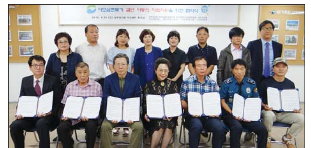
사진은 결연아동의 자립 지원을 위한 협약식 모습.