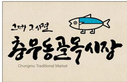
충무동골목시장 상징 디자인.

‘고갈비 특화거리’는 골목시장 사거리에 위치한 속칭 ‘파전골목’을 주구간으로 이 일대 9개 점포를 고갈비 특화 음식점으로 만들어 조성된다. 또 ‘파전골목’ 옆 충무소풍방향의 통행로에는 식자재 등 잡화와 순대 등 먹거리를 판매하는 ‘할