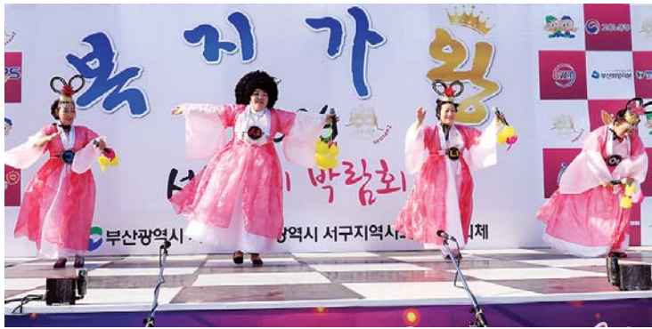
사진은 ‘복지스타★ 개사가요제’에서 1위를 차지한 서구시니어클럽 경연 모습.

공유와 연대 강화의 장을 마련했다. 특히 올해에는 보다 많은 사람들의 참여를 이끌어내기 위해 국내