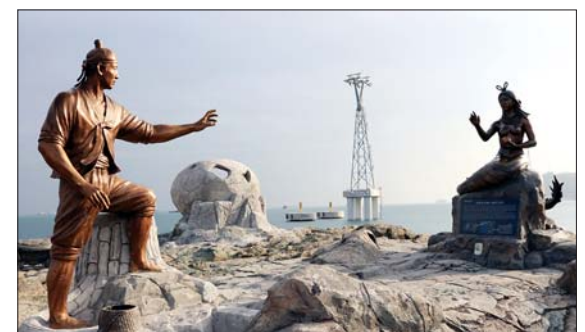
사진은 해녀들에게 발견돼 극적으로 되돌아온 어부상(왼쪽).