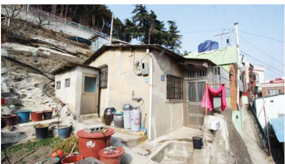
사진은 저비용 친환경 리모델링 예시.

이 사업은 저소득층이나 전입가구 등의 신청을 받아 노후주택에 대한 리모델링 교육을 실시해 저비용 친환경 기술을 적용한 주택을 보급하는 것이다. 또 주민들을 대상으로 기초 집수리 교육을 실시해 간단한 집수리를 하도록 하는 것은 물론 초장동 마을지기사무소나 지역 내 집수리 봉사단체 등과의 상호연대 및 커뮤니티 활동을 유도해 향후 ‘아미·초장집수리단’ 전문인력도 양성한다. 이로써 원주민 유출 방지 및 새로운 인구 유입 효과도 예상하고 있다.