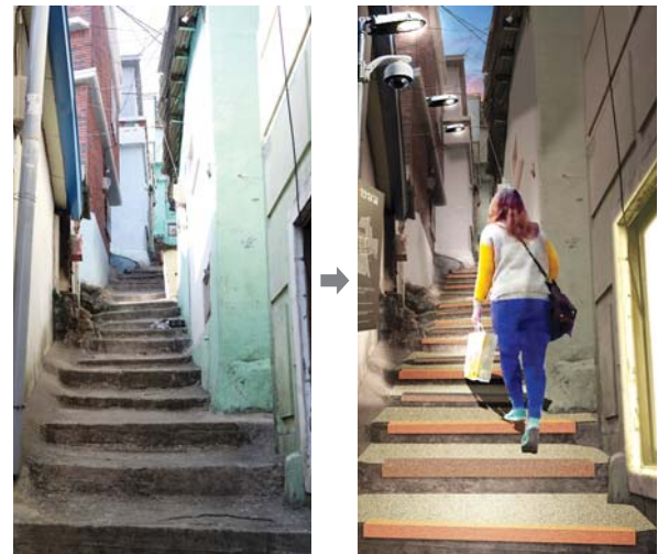
사진은 안심골목 조성사업 예시.

안심골목 조성은 어두컴컴하고 좁은 골목길을 범죄예방환경설계(셉테드)를 적용해 범죄발생 가능성을 사전에 차단함으로써 주민들이 주·야간 안심하고 다닐 수 있는 골목으로 바꾸는 것이다. 또 안전도로 조성은 도로변 버스정류장을 커뮤니티 안전정류장으로 만들어 친보행환경 구축, 어린이·노약자 및 경사지 주민의 안전한 옥외활동을 조성하는 것이다.