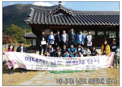
떠나자! 남도 문화재 답사