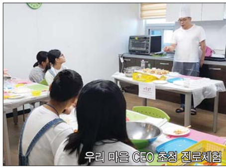
우리 마을 CEO 초청 진로체험