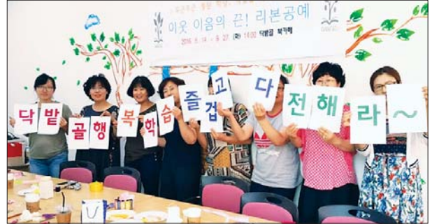
사진은 닥발골행복학습센터 수강생들의 모습.