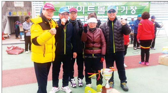
사진은 부산생활체육축전에서 우승한 서구게이트볼협회 선수들의 모습.

먼저 '2016 구민생활체육대회'는 지난 10월 30일 구덕운동장 주경기장과 종목별 경기장에서 생활체육 동호인 등 800여 명이 참가한 가운데 개최됐다. 대회는 지난 7월 개최된 태권도를 제외한 6개 종목으로 치러졌는데 우승은 △축구 황호클럽 △배드민턴 서부클럽 △테니스 구덕클럽(금배조)·해송클럽(은