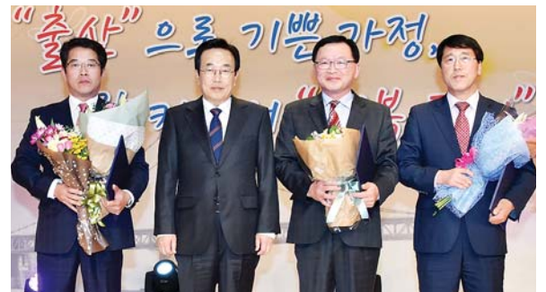
사진은 ‘2016년 출산장려 구·군 경진대회’ 시상식 모습.

서구가 출산 문제의 극복과 출산장려 사회분위기 조성을 위해 실시한 부산시 주최 ‘2016년 출산장려 구·군 경진대회’에서 장려상을 수상했다.