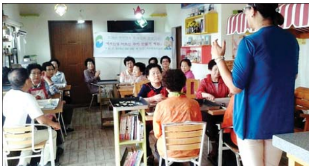
사진은 백세인생 어르신 쿠키 만들기교실 모습.