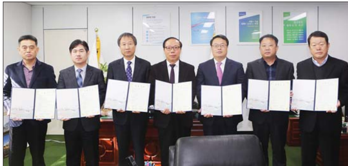
사진은 대형 건설사업 6개 시공사와의 MOU 체결 모습.

서구는 이날 MOU 체결을 통해 시공사들에게 관내 사업 추진 시 하도급 70% 이상을 지역업체들이 수주할 수 있도록 해줄 것과, 특히 건축공사장 인력고용 시 구민들을 우선 채용함으로써 주민 일자리 창출에도 적극 협조해 줄 것을 요청했다.