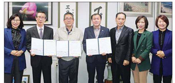
사진은 ‘행복홀씨 입양사업’ 협약식 모습.

서구가 지난해부터 추진하고 있는 ‘행복홀씨 입양사업’이 민들레 홀씨처럼 관내 곳곳으로 퍼져나가고 있다.