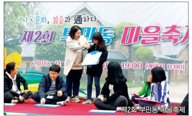
제2회 부민동 마을축제