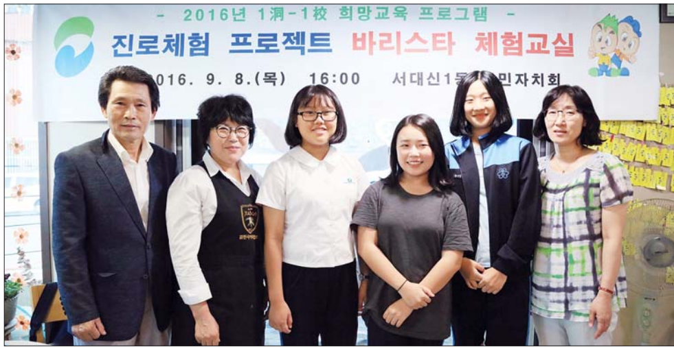
사진은 고분도리 협동조합 관계자들이 '진로체험 프로젝트, 바리스타체험교실'에 참가한 학생들과 기념촬영을 하고 있는 모습.