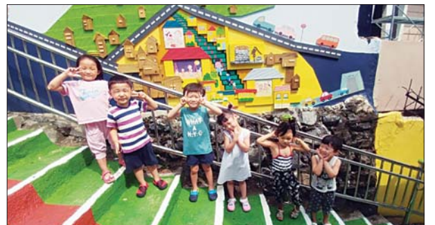
사진은 마을벽화 앞에서 포즈를 취한 어린이들의 모습.