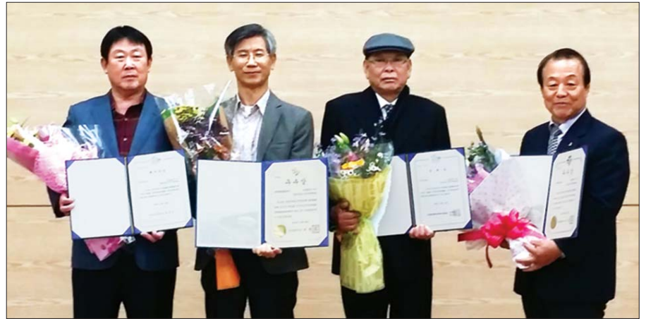
사진은 전국주민자치박람회 시상식 뒤 수상한 4개 동 관계자들이 기념촬영을 하고 있는 모습.

서구는 지난 2005년부터 박람회에 참가하고 있으며 올해 수상으로 12년 동안 단 한 번도 빠지지 않고 우수사례로 선정되는 쾌거도 이루었다. 게다가 지난 2012년부터는 해마다 5~6개 동 주민자치회가 수상의 기쁨을 누리고 있다. 특히 2014년에는 대상(국무총리상)을 비롯해 6개의 상을 휩쓸어 화제를 불러일으켰으며, 덕분에 주민자치 모범도시로 여타 지자체