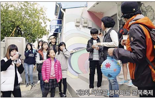
제3회 닥밭골 행복마을 골목축제