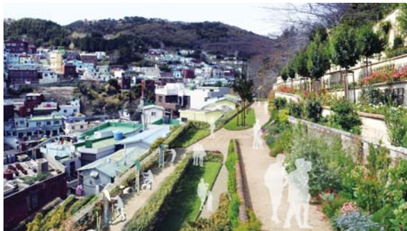
사진은 우리 동네 쌈지마당 만들기사업 예시.

이 사업은 방치되고 있는 폐·공가나 나대지 등 유휴공간에 주민쉼터나 놀이터, 운동공간 등 다양한 기능을 할 수 있는 쌈지마당을 조성해 부족한 기초생활 인프라를 구축하는 것이다. 주민들의 커뮤니티 공간으로서의 기능은 물론 갈수록 늘고 있는 폐·공가의 우범지대화를 방지할 수 있다.