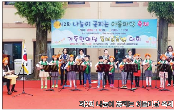
제2회 나눔이 꽃피는 어울마당 축제