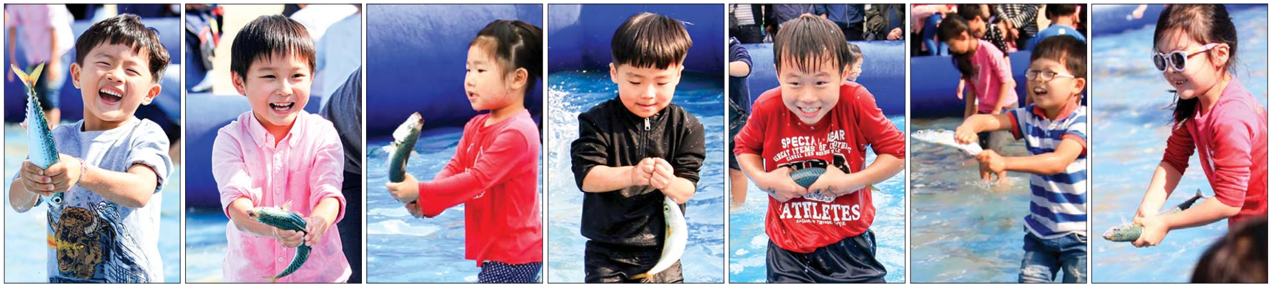
“엄마, 잡았어요!”, “앗, 놓쳤네!” 올해 부산고등어축제에서는 다양한 체험 및 참여행사가 마련돼 방문객들을 즐겁게 했다(사진은 ‘맨손 고등어 잡기’ 에서 고등어를 잡고 즐거워하는 어린이들의 모습).