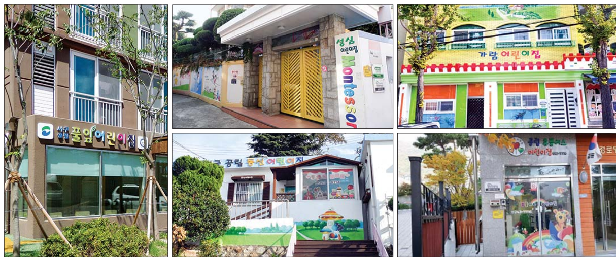
사진은 서구가 올해 처음 선정한 '열린어린이집' 5개소. 사진 왼쪽부터 시계방향으로 풀잎·성심·가람·휴플러스·동신 어린이집.