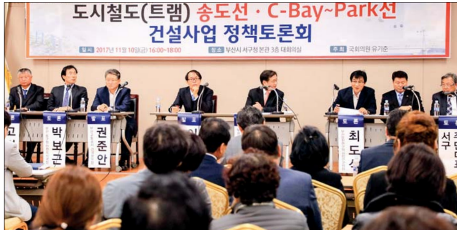
사진은 지난 11월 10일 서구청 대회의실에서 개최된 도시철도 송도선 건설사업 정책토론회 모습.

공 중인 감천지하차도와 건설 예정인 구평지하차도의 완공시점인 2020년 이후 공사가 이루어질 수 있어 사업시기가 늦어질 것이라는 전망이 나오고 있으며, 지하구조물 설치 사업비가 증가해 경제적 타당성 확보 방안도 필요한 실정이다. 이번 정책토론회는 이같은 계획을 주민들