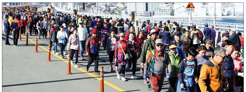
사진 위부터 고등어 푸드코트, ‘고등어 회 썰기 & 회초밥 만들기’, 고등어 롤렛 이벤트, 축제 10주년 기념 특별콘서트(장미여관 공연), 남항대교 걷기 대회 모습.

○… 축제는 첫날인 27일 오후 7시부터 펼쳐진 ‘축제 10주년 기념 특별콘서트’에서부터 후관 달아올랐다. 정훈희·홍진영·장미여관·서지오·조승규 등 특급가수들이 무대에 올라 자신의 히트곡과 트로트 메들리로 순식간에 분위기를 띄웠다. 특히 아미동 출신인 정훈희는 걸쭉한 부산사투리로 어