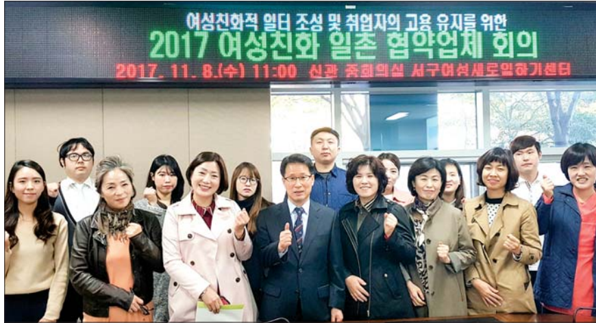
사진은 지난 11월 8일 오후 서구여성새로일하기센터와 일촌 협약을 맺은 채용업체 관계자들이 회의가 끝난 뒤 기념촬영을 하고 있는 모습.

다음은 2017년 ‘일촌 협약’ 체결 기업. △늘사랑요양병원 △실버웰요양센터 △정요양병원 △안나노인건강센터 △큐테크 △부산노인재가