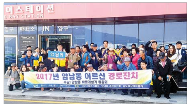
사진은 해상케이블카 탑승 전 기념촬영을 하고 있는 모습.

바르게살기운동 암남동위원회(위원장 박철완)가 관내 거주하는 어르신과 경로당 10여 곳의 어르신 등 200여 명을 초청해 지난 11월 3일 주민센터 2층 다목적강당에서 경로잔치를 마련했다.