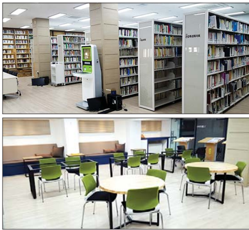
사진은 리모델링을 통해 새롭게 단장한 구덕도서관 입구와 종합자료실 등 내부 시설 모습.