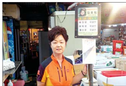
사진은 ‘원산지 포토실명제’ 참가 점포 모습.

주민자치회는 새벽·해안·골목시장 등 3개 전통시장이 밀집해 있는 지역특성을 반영해 시장 상인회와 함께 ‘주민과 상인이 함께하는 마을 만들기’를 목표로 다양한 사업을 추진하고 있다. 이 가운데 원산지 포토실명제는 제각각이던 3개 시장