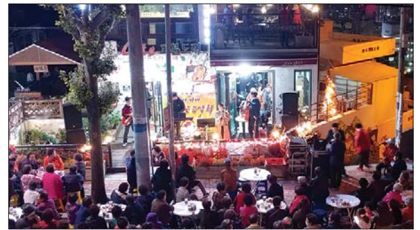
사진은 지난 11월 3일 개최된 '고분도리카페 작은음악회' 모습.

서대신1동 주민자치회(위원장 오용철)와 지역사회보장협의체(위원장 송만영)가 함께 마련한 ‘차와 음악이 흐르는 고분도리카페 작은 음악회’가 지난 11월 3일 고분도리카페에서 개최됐다.