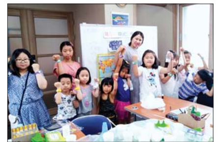
사진은 ‘아이야, 함께 가자’ 참가자들 모습.

‘하나 되는 동행마을’은 △아이야, 함께 가자 △문화로 함께 가자 △손에 손 잡고 함께 가자 등 3가지 ‘동행’으로 추진됐다. 이 가운데 △아이야, 함께 가자는 제2회 어린이독서 ‘도전! 골든벨’, 나만의 보물 지도를 찾아라!, 꿈나무들의 즐거운 생활 등으로 진행됐는데 아이들에게 독서를 생활화하고 또래 간 공감대 형성과 마을공동체에 대한 소속감을 갖게 하는 계기를 마련했으며, 자원