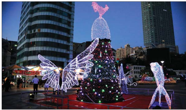
사진은 지난해 송도 트리문화축제의 트리 조형물과 빛 조형 장식물 모습.

27일 오후 6시 점등식을 시작으로 12월 26일까지 다양한 경관조명과 오색 찬란한 빛 조형물 등으로 빛 문화거리가 조성된다.