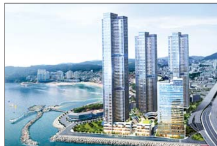
사진은 현대 힐스테이트 이진베이시티 조감도.