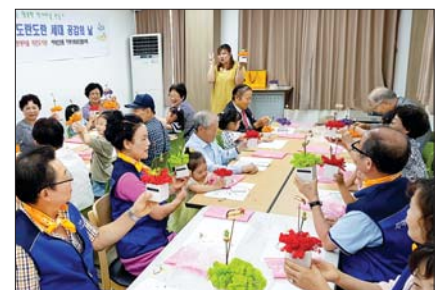
사진은 ‘도란도란 세대공감의 날’ 행사 모습.

서대신3동은 기존 토착민과 재개발지역 이주민 간의 이질감 해소가 큰 숙제였는데 주민자치회는 다양한 마을공동체가 참여하는 지역축제를 통해 교류의 장을 마련하고 재능 및 물품 기부를 통해 나눔 및 공생의 문화를 확산시키는 것으로 해결의 실마리를 찾고자 했다. 이에 따라 ‘나눔이 꽃피는 어울마당 축제’는 어르