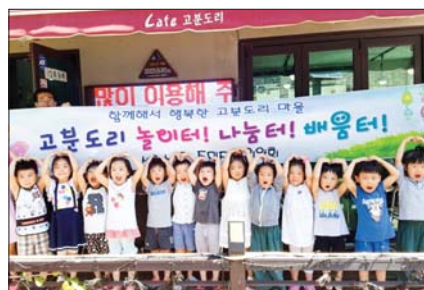
사진은 ‘고분도리 놀이터’ 참가 아동 모습.

이 가운데 ‘고분도리 배움터’는 배움문화 확산을 위한 공모사업 프로그램, 민·관·학이 함께하는 지역