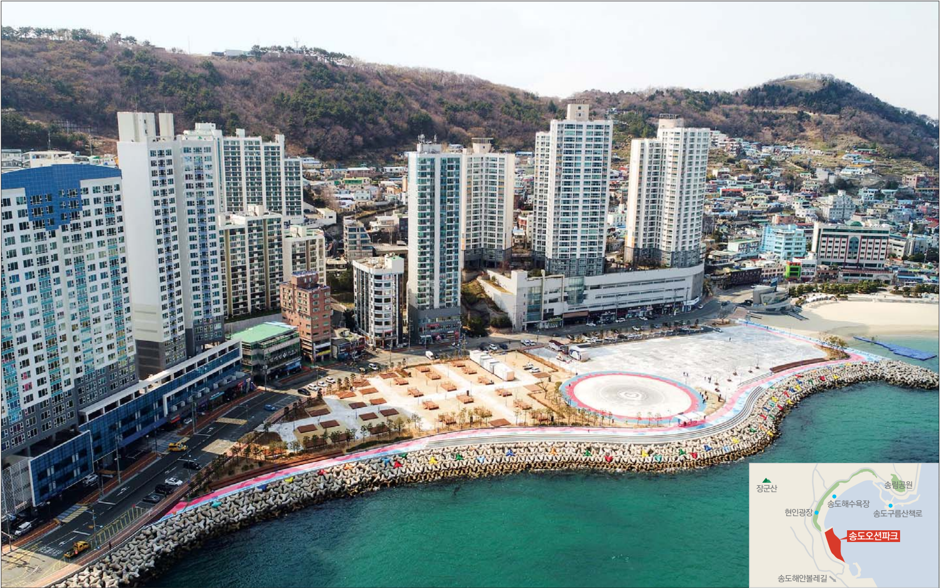
송도해수욕장 지도 바꾼 大役事 준공 송도해수욕장을 비수기가 없는 사계절 국민여가휴양지로 만들기 위해 추진됐던 송도지구 복합해양휴양지 조성사업 중 해수욕장 서편 2구역의 송도오션파크 조성사업이 3월 중순 준공됐다(사진은 드론으로 촬영한 송도오션파크 전경).