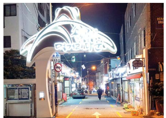
사진은 송도해수욕장 인근 백년송도 골목길 입구 모습.

한편 착한가격업소란 부산시가 지역경제 활성화와 물가안정을 위해 지난 2001년부터 운영하는 것으로 인건비·재료비 등이 지속적으로 상승하는 상황에도 원가절감 등 경영효율화를 통해