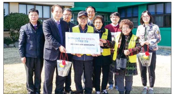
사진은 남성여고로 배달봉사에 나선 천사실버봉사대 모습.

부민동 마을기업인 부민하늘농원협동조합(이사장 구자홍·이하 부민하늘농원)이 3월부터 어르신 배달봉사원인 천사실버봉사대를 운영해 매출 향상과 노인일자리 창출이라는 두 토끼잡기에 나섰다.