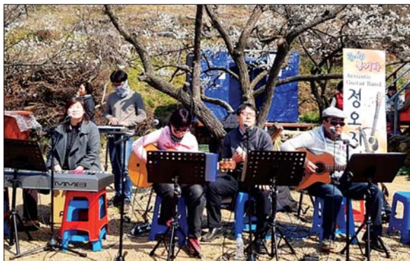
사진은 통기타밴드 '정오지나'의 공연 모습.

몇 년 전부터는 암남동에 따로 연습실까지 마련해 매주 목요일 저녁이면 전 멤버가 한 자리에 모여 2시간씩 화음을 맞춘다. 이렇게 연습해서 부산시나 각 구청에서 열리는 축제나 행사에서 공연을 하고 있는데, 때로는 타 지역으로 장거리공연에 나서기도 한다. 재작년 제3회 지방자치의 날을 맞아 세종시에서 열렸던 전국 아마추어공연단 초