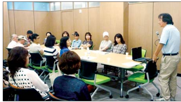
사진은 송도바다작은도서관의 문화강좌 모습.

이지(jumin.busan.go.kr/dong/amnam)를 통해 선착순 접수하며, 참가비는 무료이다.