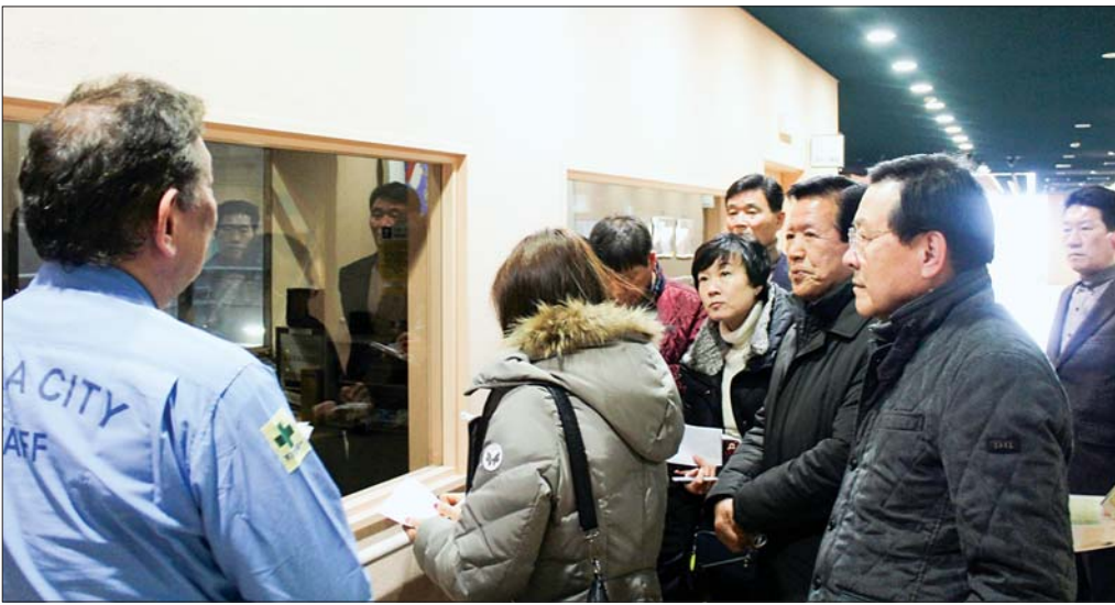
사진은 의원들이 오사카 마이시마환경위생센터에서 관계자로부터 친환경 쓰레기처리시설에 대한 설명을 듣고 있는 모습.

다. 어르신 개개인이 자기 방을 이용하면서 공동으로 사용하는 거실과 주방 등을 유닛 단위로 제공받아 독립적이면서도 여럿이 어울려 생활하고 있었다. 시설에는 총 16개의 유닛이 있는데 1개 유닛에 10명씩 배정해 총 160명을 수용하고 있었다. 특히 수용인원 대 복지종사자의 비율을 1대 0.9명으로 해 꼼꼼하고 세심한 배려가 가능하도록 한 점이 돋보였다.