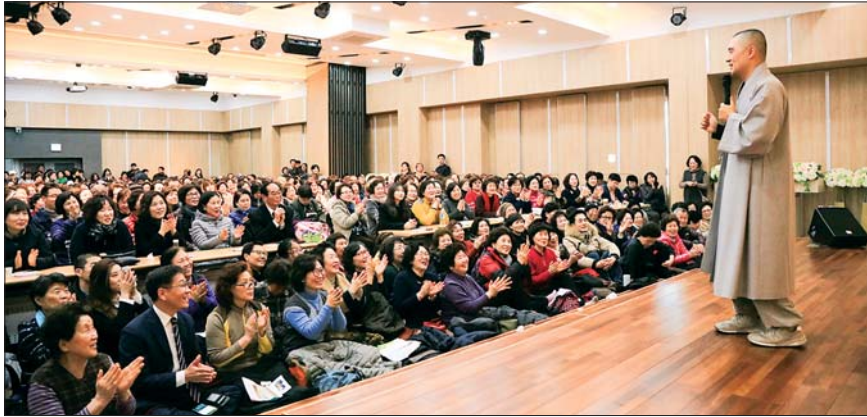
사진은 지난 3월 9일 개최된 올해 첫 서구미래아카데미에서 헤민 스님의 강연 모습.

이날 서구미래아카데미는 개강 10주년을 맞아 주민 설문조사에서 '다시 듣고 싶은 강연자' 1위로 선정된 헤민 스님을 초청해 앙코르강연으로 마련됐다.