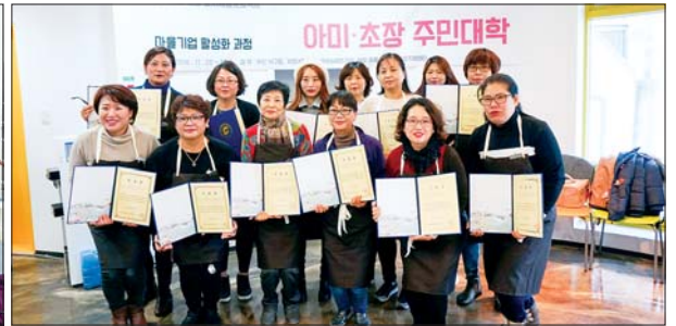
아미·초장 도시재생 프로젝트에서는 주민들이 이번 프로젝트를 체감할 수 있도록 주민참여사업이 활발하게 추진되고 있다(사진은 아미·초장동에서 있었던 다양한 주민참여 행사 모습).