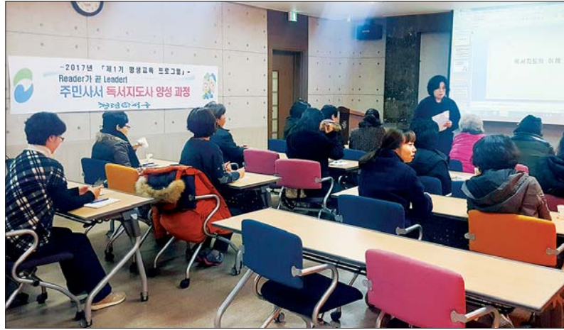
사진은 평생교육프로그램인 '주민사서 독서지도사 양성과정' 수업 모습.

또 미니멀리저 컨설턴트 양성과정은 중년층을 겨냥한 것으로 미니멀리즘처럼 생활에 필요한 최소한의 물품만을 선별해 생활 동선에 가장 적합한 위치와 공간에 적절하게 배치·정리·수납하는 것을 컨설팅하는 정리수납전문가 양성과정으로 최근 급부상하고 있는 직업군 가운데 하나다.