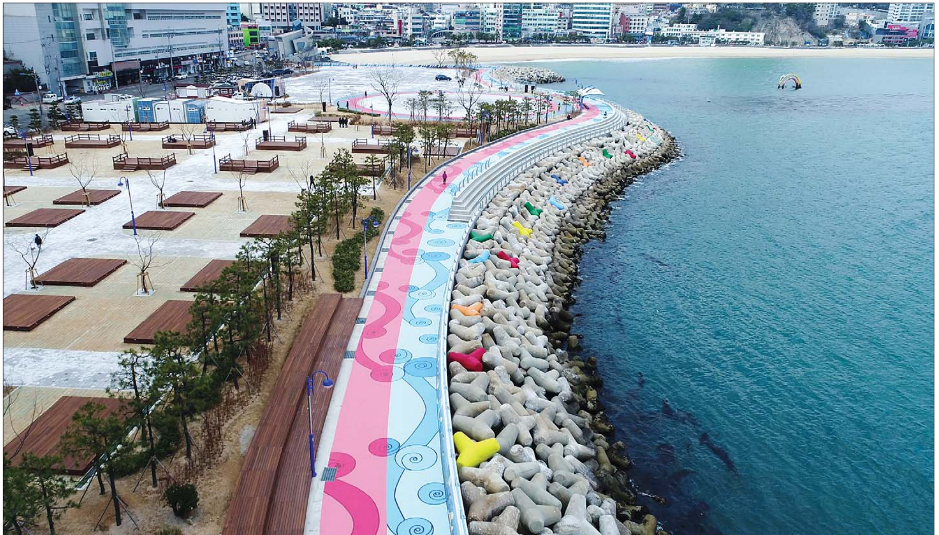
송도오션파크는 대형 텐트와 카라반 사이트를 갖춘 오토캠핑장과 조망스탠드·선베드·파고라가 설치된 해안산책로가 일품이다(사진은 드론으로 찍은 해안산책로 일대. 사진 왼쪽이 오토캠핑장).