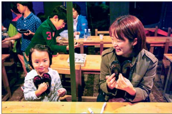
사진은 지난해 9월 '피란수도 부산야행' 행사에서 검정고무신 꾸미기에 참가한 아이의 모습.

참가 신청은 4월 참가자는 3월 24일부터, 5월 참가자는 4월 24일부터 임시수도기념관 홈페이지