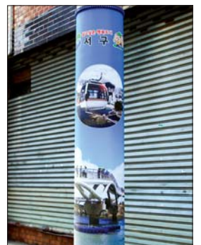
불법 광고물 부착방지판