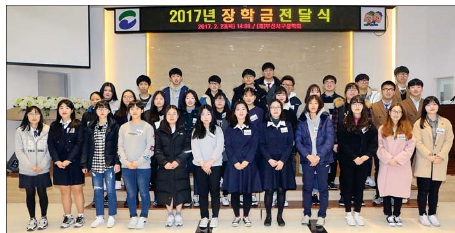
사진은 올해 서구장학회 장학생들이 장학금 전달식이 끝난 뒤 기념촬영을 하고 있는 모습.

한편 지난 2013년 6월 공식 출범한 서구장학회는 그동안 수산기업인들이 통 큰 기부에서부터 우유배달원의 짚뚱까지 지역인재 육성에 대