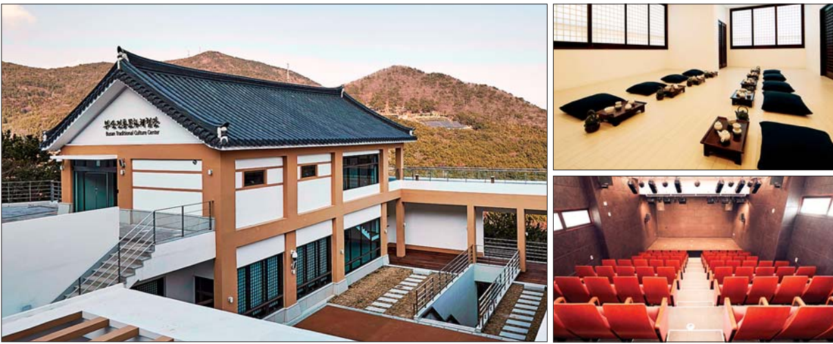
사진은 오는 4월 12일 구덕문화공원 내에 개관하는 부산전통문화체험관 건물 외관과 내부 모습.