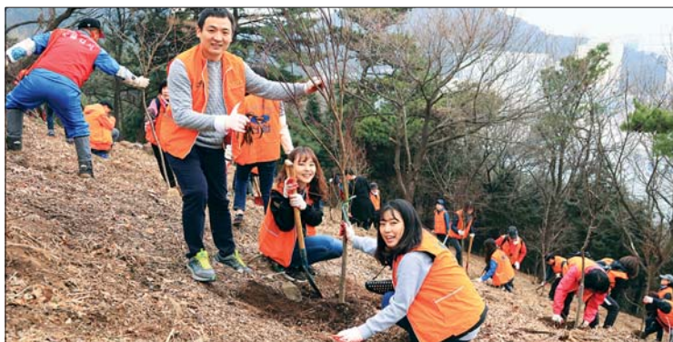
사진은 지난 3월 18일 '구민 나무심기의 날' 행사에 참가한 구덕신협 직원들.

화단을 정비하는 등 자체적으로 관련 행사를 실시했다. (문의 경제녹지과 240-4545)