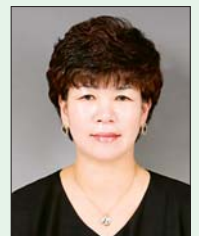
우 윤 입 으뜸어린이집 원장

온실가스 감축! 금전적으로는 물론 아이들의 건강에도 도움이 되기에 앞으로는 모든 직원들이 다 같이 꾸준하게 실천할 수 있도록 매뉴얼도 만들어 실천해야겠다고 다짐한다.